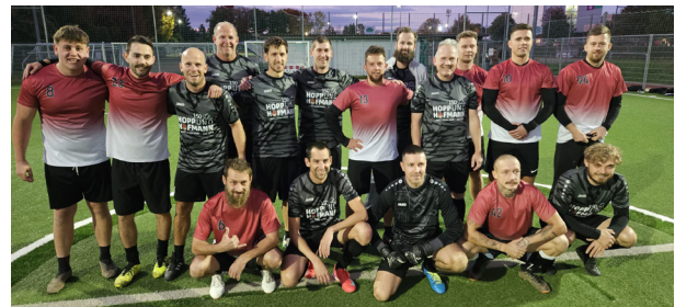
Abb. 4: Mannschaftsfoto Freitagskicker – Polonia United

Nach dem vierten Spieltag liegen wir auf dem 6. Platz, wobei wir aber erst drei Spiele, zwei Siege und ein Unentschieden, absolviert haben.